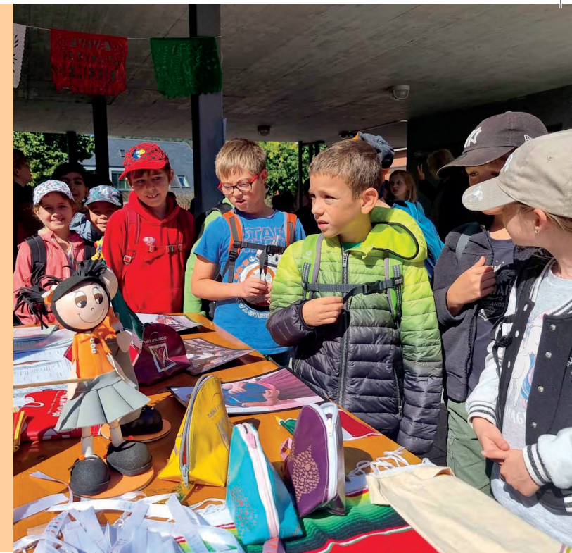
Engagiert im Einsatz für taki mundo. 800 Schüler*innen aus Würenlos sammelten beim Spendenlauf für unsere Schule.