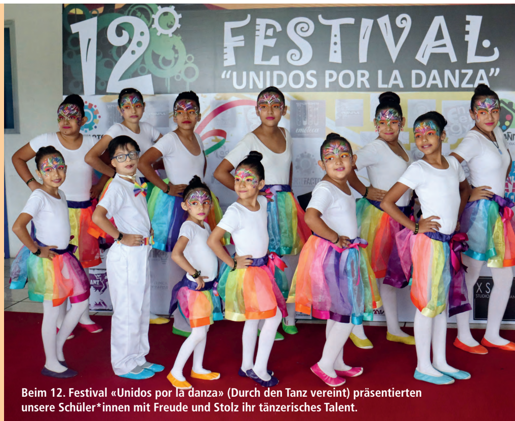
Beim 12. Festival «Unidos por la danza» (Durch den Tanz vereint) präsentierten unsere Schüler*innen mit Freude und Stolz ihr tänzerisches Talent.