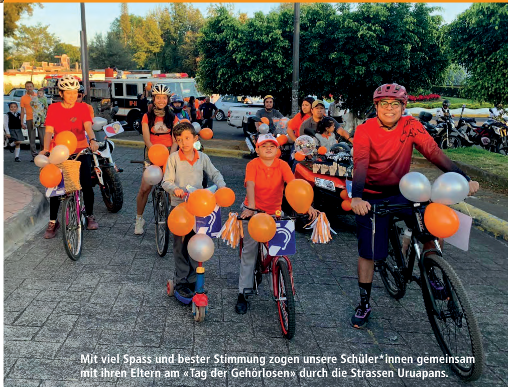
Mit viel Spass und bester Stimmung zogen unsere Schüler*innen gemeinsam mit ihren Eltern am «Tag der Gehörlosen» durch die Strassen Uruapans.