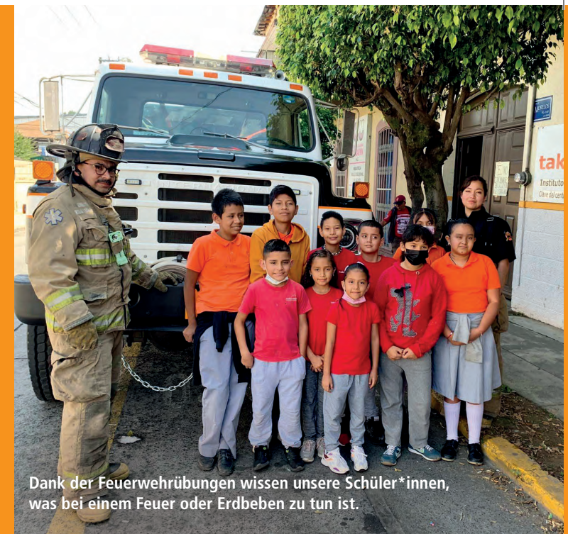
Dank der Feuerwehrrübungen wissen unsere Schüler*innen, was bei einem Feuer oder Erdbeben zu tun ist.