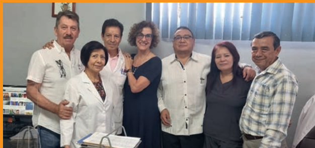
Freude herrscht über unsere Spende an das «Hospital Civil de Uruapan Dr J. Jesús Silva A.C.»