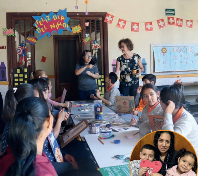
Nicht-Hörende und Hörende, Kinder und Erwachsene lernen voneinander für ein besseres Miteinander.