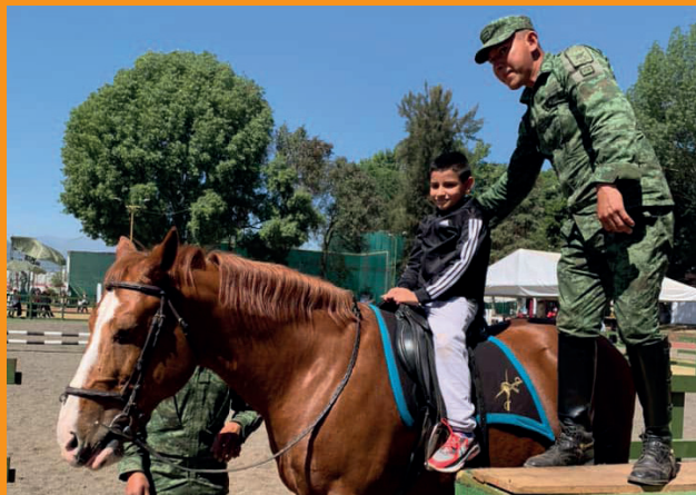
Hoch zu Ross dank der Mexikanischen Armee.