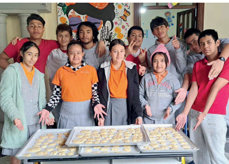
Dank unserer neuen Backwerkstatt wird jetzt gebacken «was das Zeug hält» und wir können unsere Schüler*innen im Backhandwerk ausbilden.