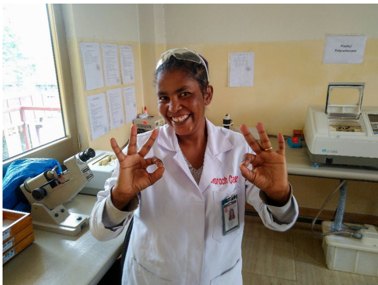
Im Misrach Center in Addis Abeba, Äthiopien versteht man auch die Gehörlosensprache.