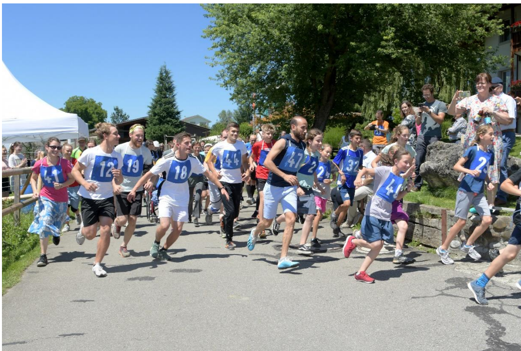
Der Sponsorenlauf an der Missionskonferenz für unsere Friedensprojekte weckte Begeisterung.