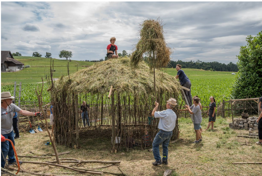
An der Missionskonferenz lernen wir Europäer, wie man eine afrikanische Rundhütte baut.