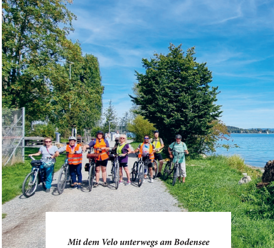
Mit dem Velo unterwegs am Bodensee