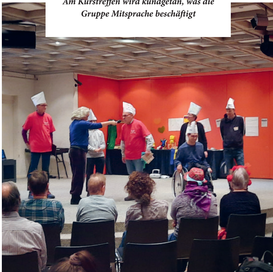
Am Kurstreffen wird kundgetan, was die Gruppe Mitsprache beschäftigt