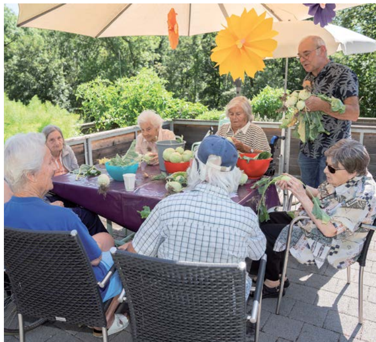
Kohlrabi-Ernte: Die Gartengruppe der Mühlehalde freut sich über den guten Ertrag aus dem Hochbeet.

auftritt von Grund auf erneuert und barrierefrei gestaltet. Und mit der Aktion «Drei Tage gratis zur Probe wohnen» wurde ein neues Angebot geschaffen, welches es den Interessentinnen und Interessenten erleichtert, sich einen Eindruck von der Pflege- und Betreuungsqualität im Wohn- und Pflegezentrum Mühlehalde zu machen und in Gesprächen mit anderen Bewohnenden und mit den Mitarbeitenden sorgfältig zu prüfen, ob die Mühlehalde das geeignete neue Zuhause wäre. In den Sommermonaten 2022 wurde dieses Angebot zusätzlich mit einer Anzeigenserie in städtischen Printmedien beworben. Es gelang uns, Bewohnerinnen und Bewohner dafür zu gewinnen, in diesen Anzeigen über ihr Leben in der