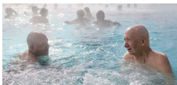
Das speziell auf Menschen mit Seheinschränkungen ausgerichtete Ausflugsprogramm (hier: Bad Zurzach) wird aus Spenden finanziert.

Die so wichtigen Aktivierungsangebote sowie die integrative Tagesstruktur können leider nicht über die öffentlichen Pflegebeiträge finanziert werden und sind auch nicht Bestandteil der Leistungsverträge. Um dieses weitherum als vorbildlich anerkannte Beschäftigungsprogramm aufrechterhalten zu können, ist die Stiftung Mühlehalde auf die finanzielle Unterstützung von gemeinnützigen Förderstiftungen und auf Spenden von Privatpersonen angewiesen.