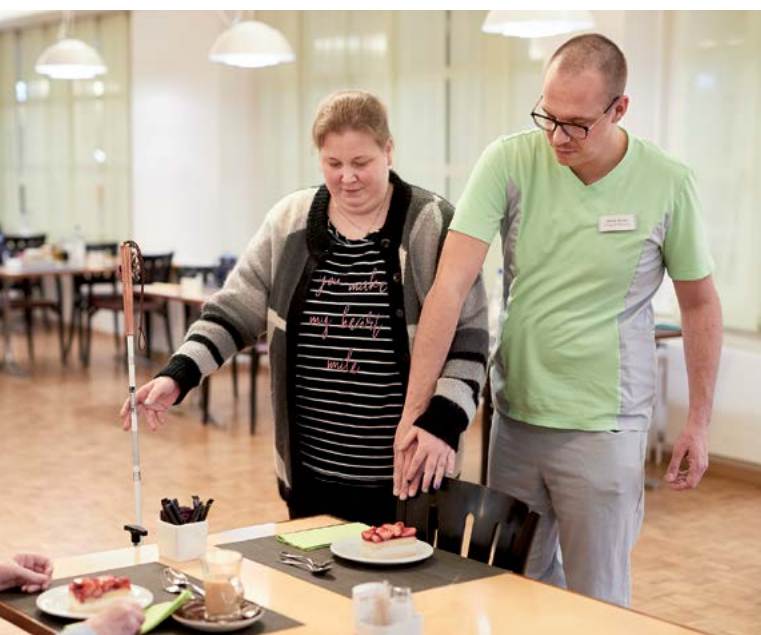
Gut begleitet: Die korrekte Führung vermittelt blinden Bewohnerinnen und Bewohnern Sicherheit im Alltag.

Mühlehalde zu erzählen. Die Kampagne führte zu etlichen neuen Kontakten, wobei die meisten Personen jedoch eher im Sinne einer Vorinformation für den späteren Eintritt Interesse zeigten. Wenn es aber zu einem Probewohnen kam, war danach die Quote derer, die sich für einen definitiven Einzug in die Mühlehalde entschlossen, hoch. Dennoch bleibt es herausfordernd, die nach wie vor bestehende Unterbelegung zu beseitigen.