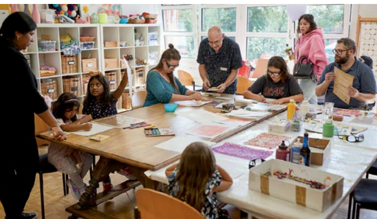
Schnupperstunde: Externe Gäste des Mühlehalde-Fests im Atelier unserer Bewohnerinnen und Bewohner.

Die Tendenz, dass älter werdende Menschen immer länger in der eigenen Wohnung bleiben und allfälligen Pflegebedarf oder Haushaltshilfe durch spital-externe Dienste abdecken, hält an. Für Institutionen wie die unsrige hat das zur Folge, dass sich der Angebotsmarkt zu einem Nachfragemarkt gewandelt hat. Statt eine Warteliste abzuarbeiten, gilt es, sich aktiv um neu zuziehende Bewohnerinnen und Bewohner zu bemühen und sie mit einem attraktiven Angebot zu überzeugen. Das Wohn- und Pflegezentrum Mühlehalde mit seinem Fachzentrum bei Blindheit und Sehbehinderung bringt gute Voraussetzungen mit, im Wettbewerb zu bestehen. Jedoch gilt es, mit Marketing in der Zielgruppe Präsenz zu zeigen. Eine erste Kampagne hat im Sommer 2022 gezeigt, dass unser Angebot Anklang findet. Marketing und öffentliche Präsenz müssen nun aber zu einem Modus mit höherer Konstanz finden.