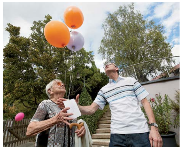
Gute Reise! Ballonpostversand am Mühlehalde-Fest 2022.

Auch haben wir ein Reglement für das Vorgehen bei Konflikten und Integritätsverletzungen geschaffen sowie eine externe und unabhängige Ombudsstelle bestimmt, die von allen Mitarbeitenden bei Problemen direkt konsultiert werden kann. Auch haben wir unser Engagement in der Ausbildung von Nachwuchs in Pflege und Hotellerie verstärkt.