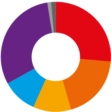
Herkunft der betrieblichen Mittel