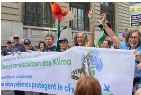
60'000 Menschen haben der Natur am 30. September in Bern eine Stimme gegeben.

Die Biodiversitätsinitiative erleidet ein turbulentes Schicksal. Die ständerätliche Kommission weigerte sich gleich zwei Mal, überhaupt eine inhaltliche Debatte zu führen. Die Kommission wollte also nicht einmal mögliche Lösungen für die Biodiversitätskrise prüfen. Bundesrat, Nationalrat, Kantone, Gemeindeverband und zahlreiche Verbände aus Wirtschaft und Gesellschaft möchten einen indirekten Gegenvorschlag für die Biodiversitätsinitiative. Die Trägerorganisationen zeigten sich sehr kompromissbereit und würden sogar einen stark abgeschwächten Gegenvorschlag akzeptieren, den die Verwaltung erarbeitet hat, aber einige Ständeratsmitglieder verweigern diesen. Die Frage eines Gegenvorschlags steht auf Messers Schneide. Erst im Dezember wird das Parlament definitiv entscheiden, ob ein solcher zustande kommt. BirdLife macht sich für einen Gegenvorschlag stark und trifft parallel Vorbereitungsarbeiten für eine allfällige Volksabstimmung, die im Frühling 2024 stattfinden könnte.