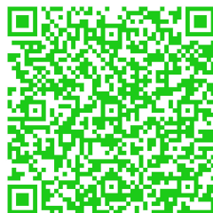
QR Code zum Podcast