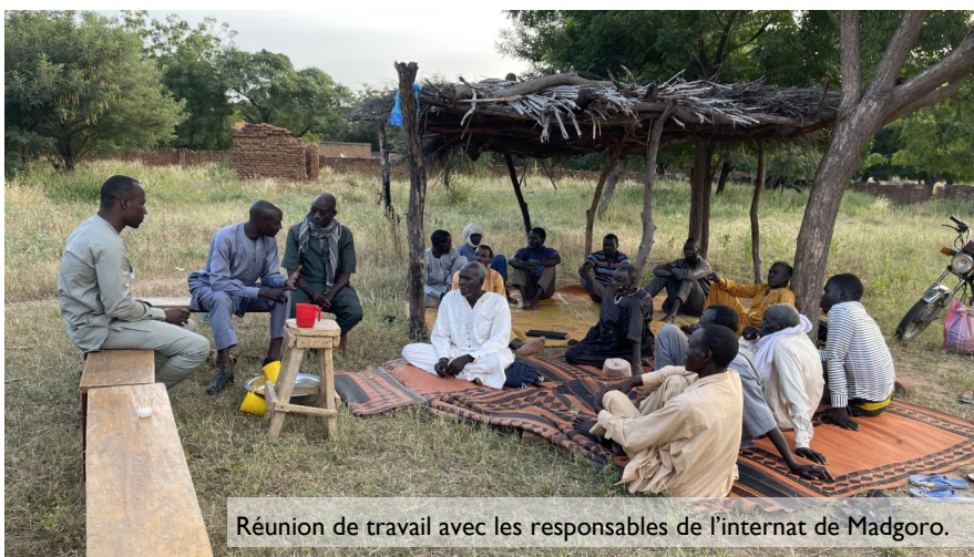
Réunion de travail avec les responsables de l'internat de Madgoro.

Le partenariat de la MET avec les organisations locales fait son chemin. Un nouveau Bureau National des Assemblées Évangéliques au Tchad (AET) est en place.