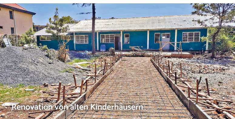
Renovation von alten Kinderhäusern