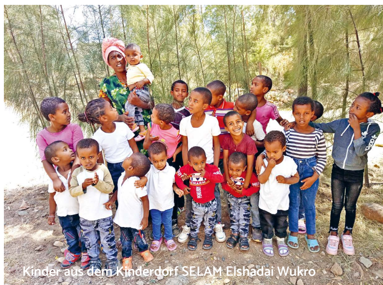
Kinder aus dem Kinderdorf SELAM Elshadai Wukro