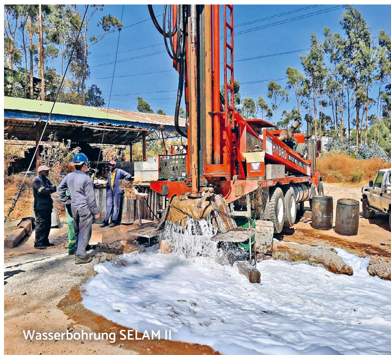
Wasserbohrung SELAM II