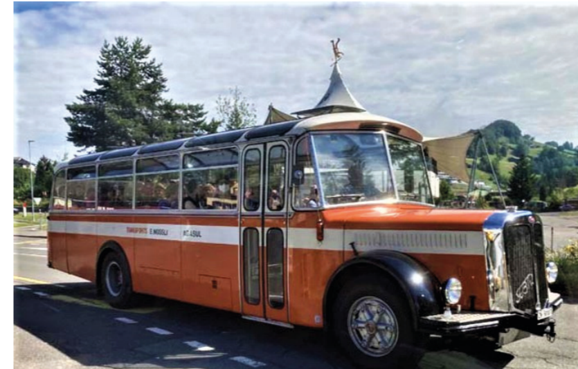
Mit «Dü-da-do» zum Jubiläumsausflug!

Am Sonntag, 26. Juni 2022 fand zum 60-jährigen Vereinsjubiläum ein spezieller Ausflug mit zwei Oldtimer-Bussen in die Innerschweiz statt. Dass diese Veranstaltung auf grosses Echo stiess, zeigte sich schon kurz nach der Ausschreibung. Über 60 Anmeldungen landeten im insieme-Büro, aber leider konnten davon nur 54 Teilnehmende berücksichtigt werden. Mit den nötigen Begleitpersonen waren nach drei Abmeldungen noch total 67 Personen an diesem Anlass dabei.