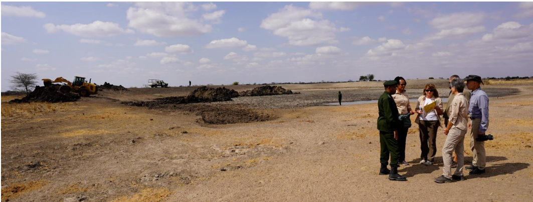
FSS Inspektionsreise: Dammbereinigung und Vergrößerung im September 2022

Die Reinigung des für die Wildtiere wichtigen Kambi-Ya-Fisi-Wasserdamms konnte aufgrund eines defekten Baggers erst im Jahr 2022 durchgeführt