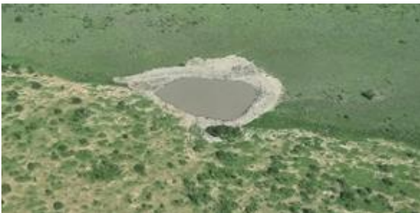
Luftbild desselben Damms im Februar 2023

Die Reinigung des für die Wildtiere wichtigen Kambi-Ya-Fisi-Wasserdamms konnte aufgrund eines defekten Baggers erst im Jahr 2022 durchgeführt