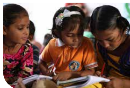
Inde - Sambhali Trust