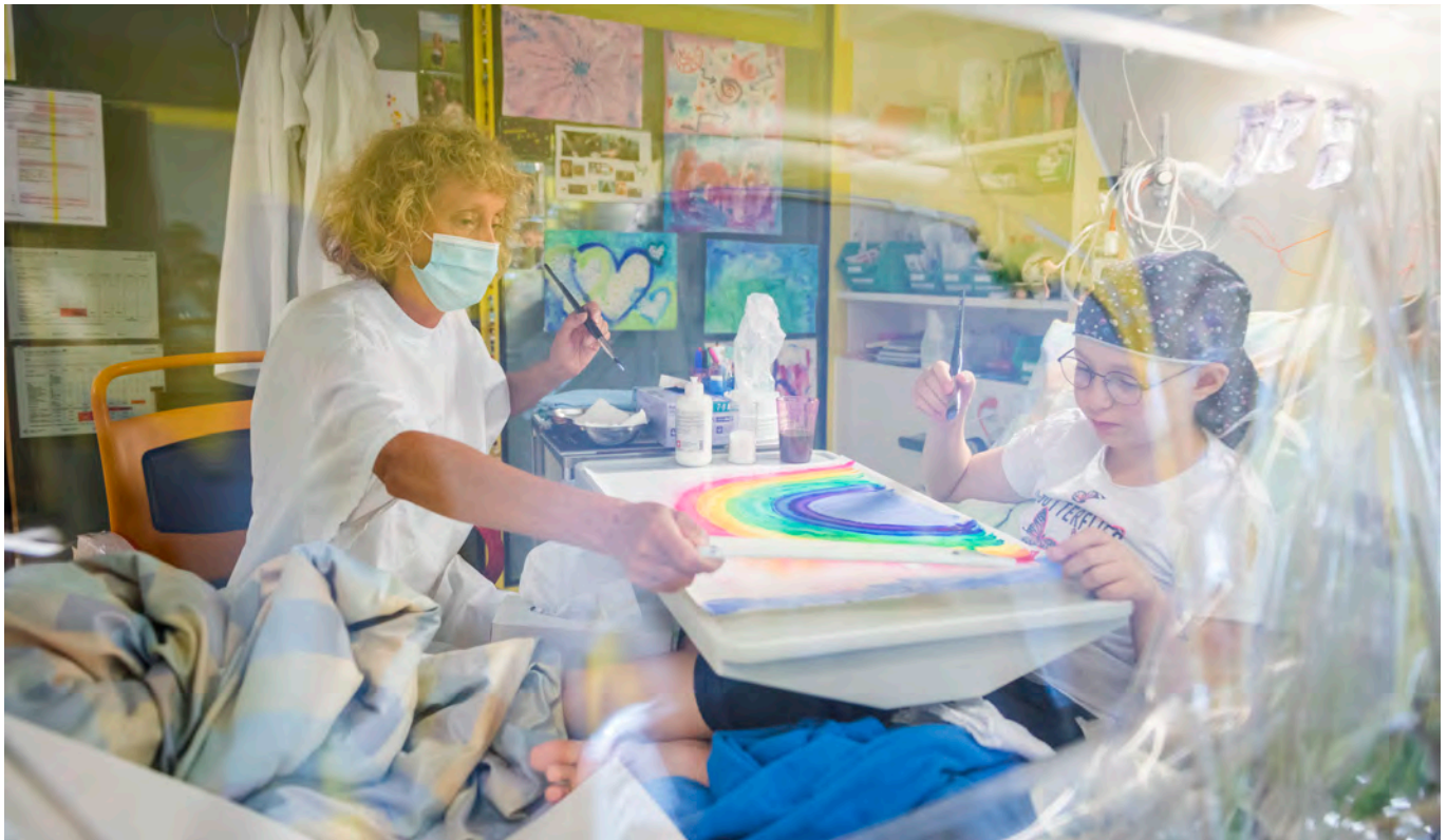
L'art-thérapie contribue à mieux supporter les longues journées ainsi que l'état de peur au service d'oncologie du Kispi Zurich.