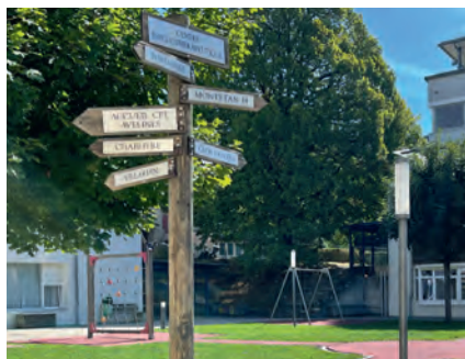
Centres de jours CHUV

Les visites de la Fondation ART-THERAPIE dans les hôpitaux partenaires, restreintes pendant la pandémie du coronavirus, sont extrêmement importantes pour une collaboration réussie. Si réunir autour d'une même table tous les médecins et thérapeutes impliqués dans le projet n'est pas une tâche facile sur le plan organisationnel, l'effort en vaut la peine. L'échange personnel permet en effet de se faire une idée précise et concrète de l'évolution des différents programmes. Ce que la jeune équipe de la fondation ne connaissait jusqu'à présent que par le biais de rapports, elle a enfin pu le vivre, l'entendre et le ressentir sur le terrain.