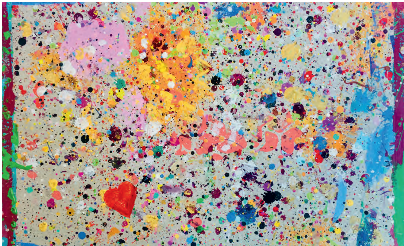
Art-thérapie au service de psychosomatique de l'hôpital de St-Gall.