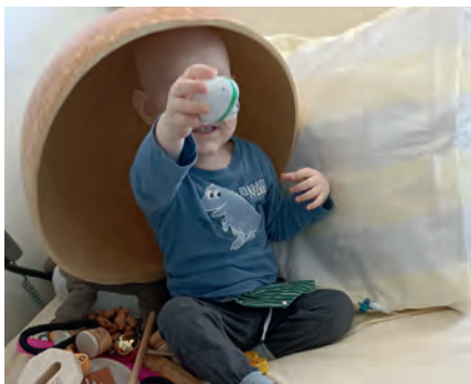
Musicothérapie chez l'enfant atteint de cancer à l'Hôpital cantonal d'Aarau.