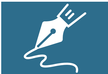
Editorial, S. 2