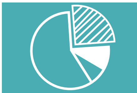
Jahresrechnung, S. 7-11