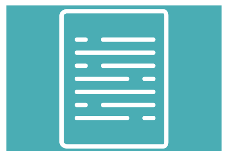
Leistungsbericht S. 4-6