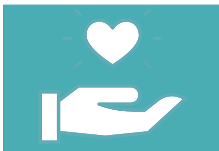
Danke, S. 12