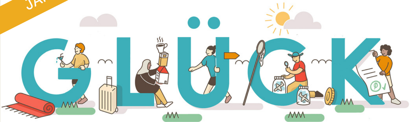
Illustration: Janik Bruschi

Der Bericht zum Jahr 2022 – das Jahr, in dem fairunterwegs die G.L.Ü.C.K.-Formel lancierte, ein Defizit einfuhr und ein erfreuliches Medienecho erzielte.