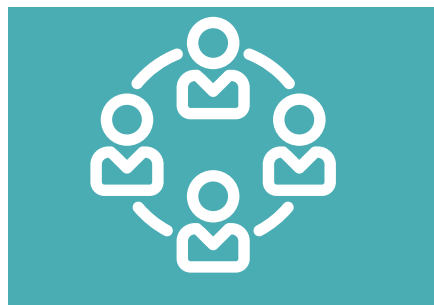
Vorstand & Team, S. 3