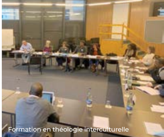
Formation en théologie interculturelle

DM a consacré sa campagne d'automne à l'ACO, mettant en avant le projet Seeds of Hope , à Anjar (Liban). Le