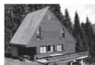
PARMORT Die Perle hoch oben auf der Alp Hochschwendi.