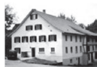
BLÄSIMÜHLE Mit wild-romantischem Tobel hinter dem Haus.