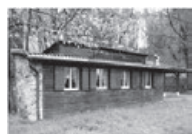
PATRIAHEIM Idyllisch am Waldrand gelegen.