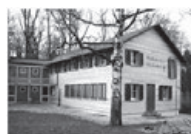
WALLISELLEN Mit eigener Arena und grosser, gedeckter Feuerstelle.