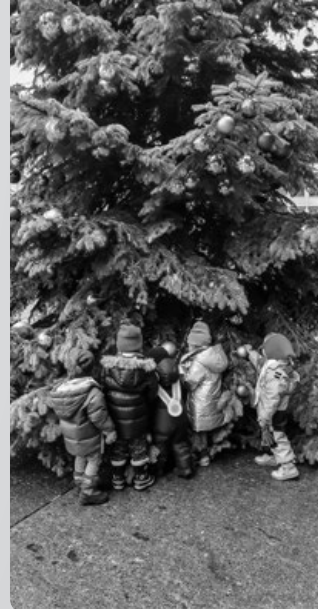
Kick for Spitak in Zürich