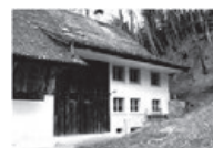
ALT ÜETLIBERG Wo sich Fuchs und Hase «Gute Nacht» sagen.

Der Heimverein des Pfadfinderkorps Glockenhof unterhält und vermietet sechs tolle Pfadiheime im Raum Zürich und St. Gallen. Pfadi-Gruppen profitieren dabei von besonders günstigen Konditionen!