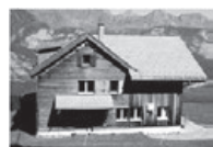
SUNNEBODE Mit atemberaubender Aussicht auf die Churfürsten.