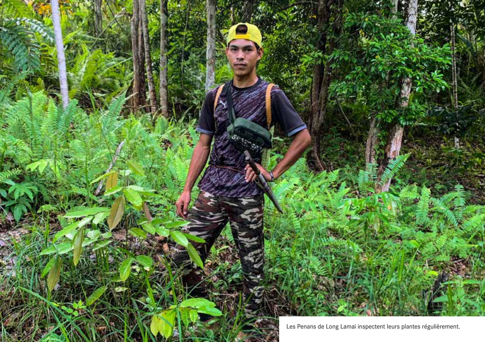
Les Penans de Long Lamai inspectent leurs plantes régulièrement.