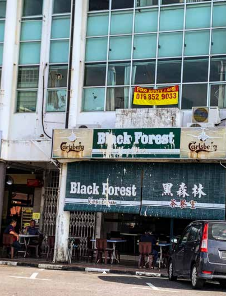
La vie dans la ville de Miri est une véritable épreuve pour les jeunes Penan.