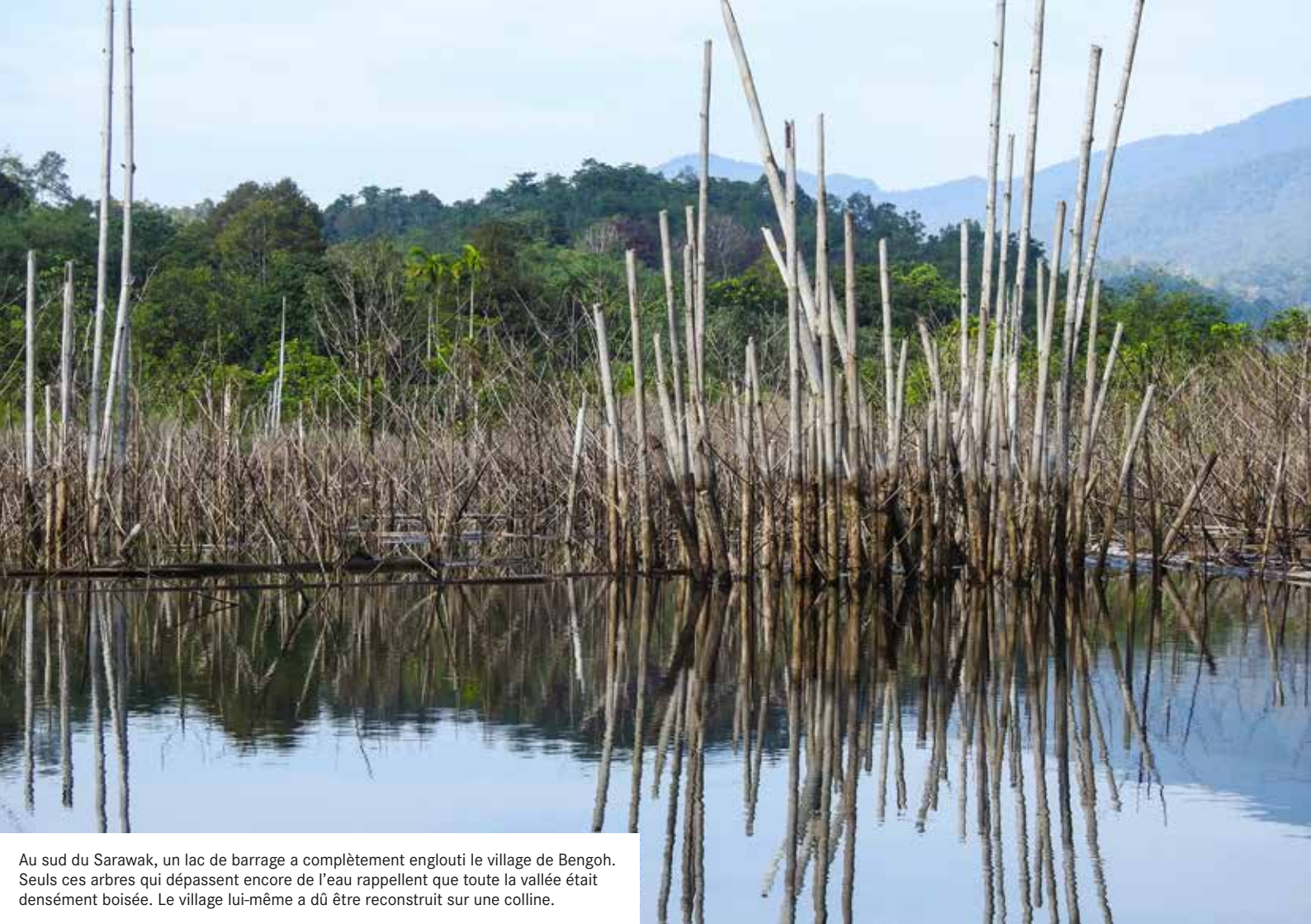
Au sud du Sarawak, un lac de barrage a complètement englouti le village de Bengoh. Seuls ces arbres qui dépassent encore de l'eau rappellent que toute la vallée était densément boisée. Le village lui-même a dû être reconstruit sur une colline.