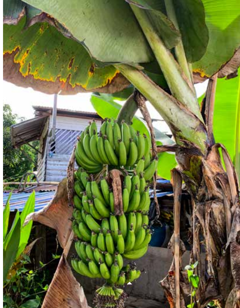
L'agroforesterie combine la durabilité écologique et économique.