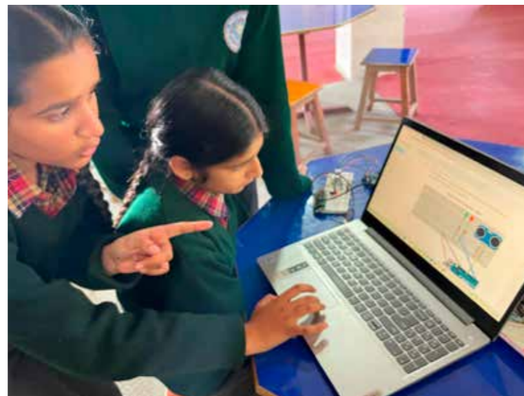
En Inde, des adolescents sont incités à trouver des solutions aux problématiques quotidiennes pour développer leurs capacités créatives (Partenaire ASED - PYDS)