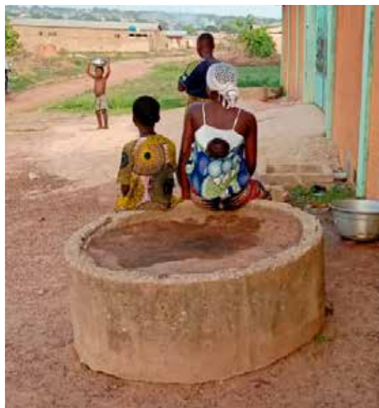
Au Bénin, l'eau potable a été amenée à l'école La Segoviana. Par la même occasion, un robinet a été installé à l'extérieur, dans la rue, à la disposition des habitants du quartier

ASED souhaite accompagner les enfants et les jeunes afin qu'ils soient à l'aise en toute situation, qu'ils sachent s'adapter aux changements à venir et qu'ils deviennent des acteurs actifs de leur société.