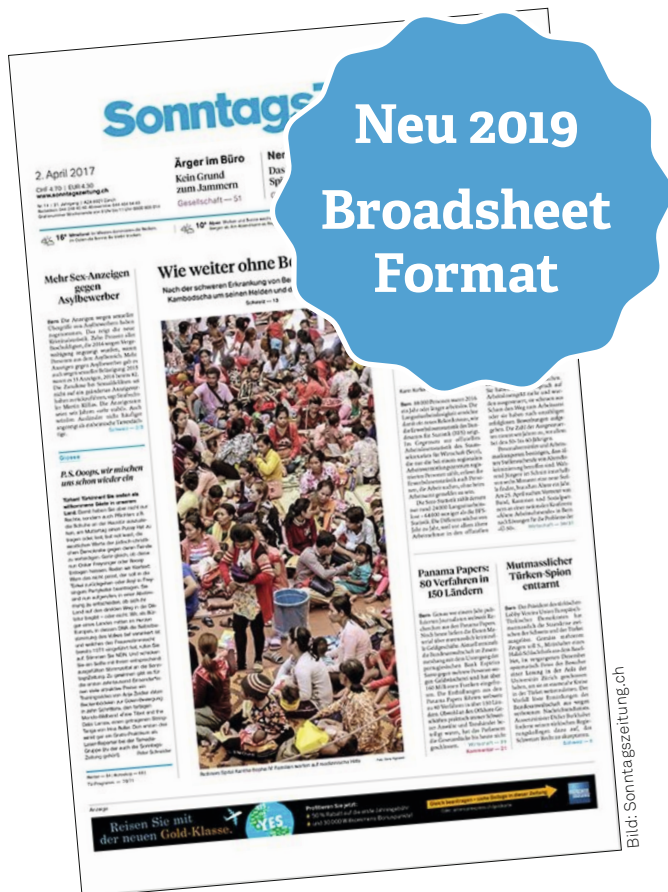
Spendenmagazin 2019 im Broadsheet Format (Bild als Beispiel für Grösse)

Die Spendenbeilage 2019 erscheint erstmals im Zeitungsformat. So ist Ihr Auftritt bestens in die Sonntagszeitung und in die NZZ am Sonntag eingebettet. Mit einem Inserat erreichen Sie fast eine Million Leserinnen und Leser.