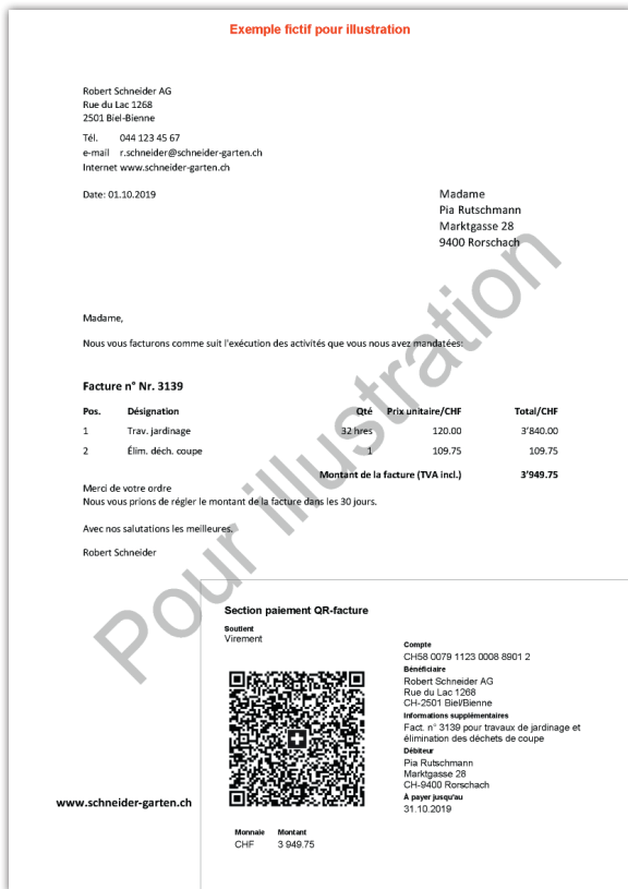
Ancienne facture QR sans récépissé

Un format plus proche du bulletin de versement