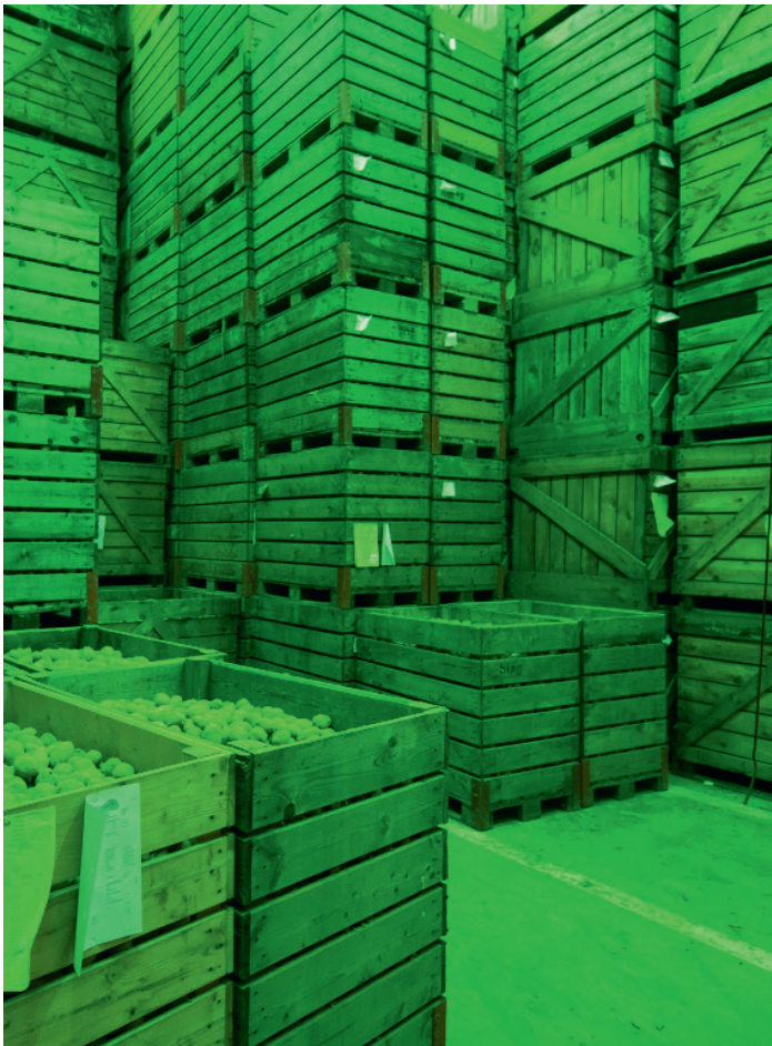
212402530 | Les pommes de terre sont stockées dans un réfrigérateur à lumière verte pour éviter qu'elles ne verdissent.