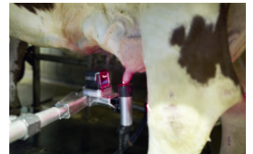
216145950 | Une machine à traire en marche.