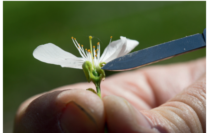
216106600 | La fleur du cerisier est entaillée pour vérifier que les abeilles sauvages ont fait leur travail dans la plantation de cerisiers.