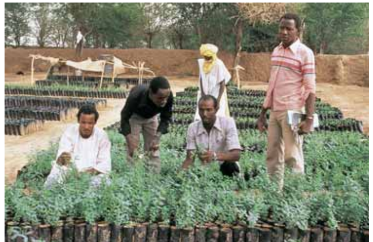
Mehr Produktion mit Bewässerung: Baumschule im Niger