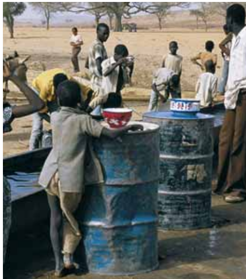
Wasserstelle im Niger

Die erwähnten gesundheitlichen Wirkungen des Programms in Bangladesch sind bedroht. Für mehr als 50 % der Bevölkerung ist durch