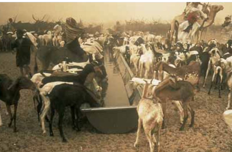
Viehtränke bei einer Pumpe im Niger