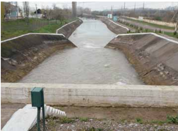
Hauptbewässerungskanal im Ferghanatal, Zentralasien

Eine wichtige Erkenntnis aus den Arbeiten zum Wirkungsbericht lautet, dass die von der Schweiz unterstützten Wasserprogramme die Erhebung von Daten über den Zugang zu Wasser und zur Wirkung verbessern müssen.