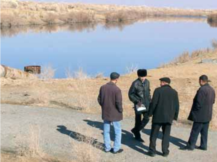
Klärbecken 30 km ausserhalb Nukus, Usbekistan