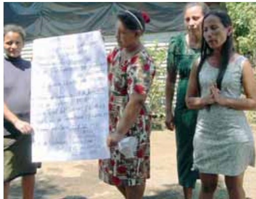
Wasserkomitee in Nicaragua: Besprechung der Tarife

Frauen profitieren bei Trinkwasserprojekten sowohl als Zielgruppe (Zeitersparnis, Erleich-