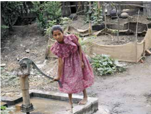
Handpumpe in Bangladesch

Zudem muss in den meisten Trinkwasserprogrammen die Entsorgungskomponente (Abwasser, Latrinen) noch verstärkt werden. Durch den erhöhten Anfall an Abwasser bei der Verbesserung der Trinkwasserversorgung ist dies zusätzlich wichtig.