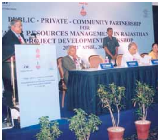
Gründung einer öffentlich-privaten Partnerschaft in Indien

Im Politikdialog gibt es Erfolge. Z.B. wurde auf Vorschlag der Global Water Partnership (GWP) in Thailand, Malaysia und Vietnam Ministerien für natürliche Ressourcen und Umwelt geschaffen, die alle Verwaltungseinheiten für Wasserressourcen unter einem Dach vereinen. Dies schafft Voraussetzungen, dass Wasser nachhaltig bewirtschaftet wird.