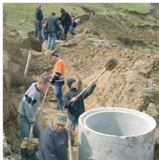
Mitarbeit der Bevölkerung in Moldawien

(DIE) untersuchte 2007 in Zusammenarbeit mit Expert/innen der Beratungsfirma FAKT die Wirkung von 10 Schweizer Wasserprogrammen in 9 Ländern. Es handelt sich dabei um Bangladesch, Kirgisien, Moldawien, Mosambik, Niger, Nicaragua, Tadschikistan, Ungarn und Usbekistan.