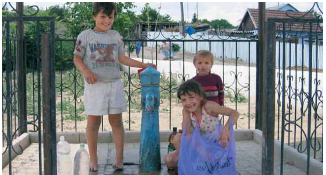
Wasserstelle in Moldawien

Probleme mit der Nachhaltigkeit kann es vor allem dann geben, wenn die Wasserge-