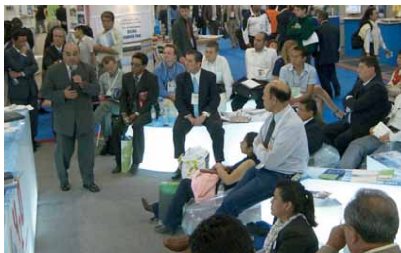
Schweizer Stand am Weltwasserforum in Mexiko, 2006