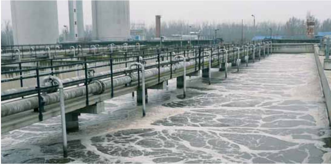
Anlage zur Wasserreinigung in Debrecen, Ungarn