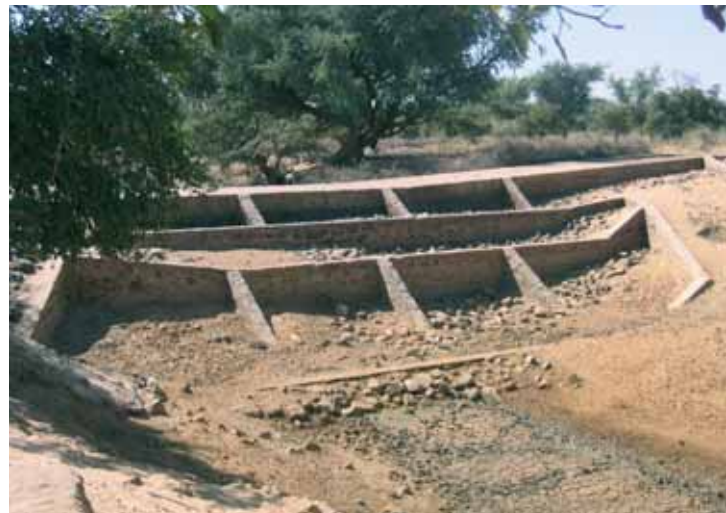
Flussschwelle in der Provinz Téra (Niger)