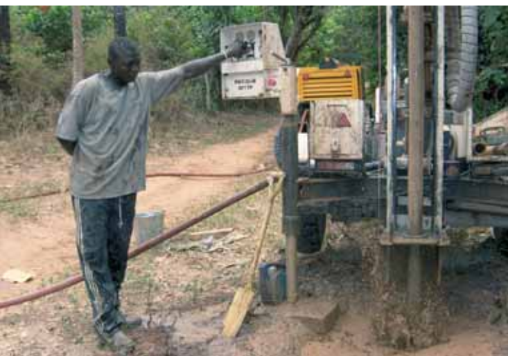
Bohrung für die einfache Installation von Wasserpumpen in Afrika

und damit ein substantieller Beitrag zur Gesundheit der Bevölkerung geleistet werden. – Der Water Supply and Sanitation Collaborative Council (WSSCC) konnte das lange Zeit vernachlässigte Thema sanitäre Grundversor-