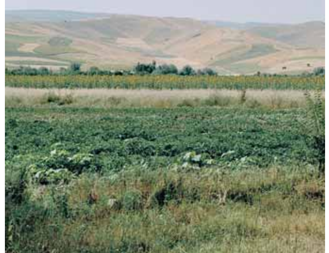
Landwirtschaft im Ferghanatal lebt von Bewässerung