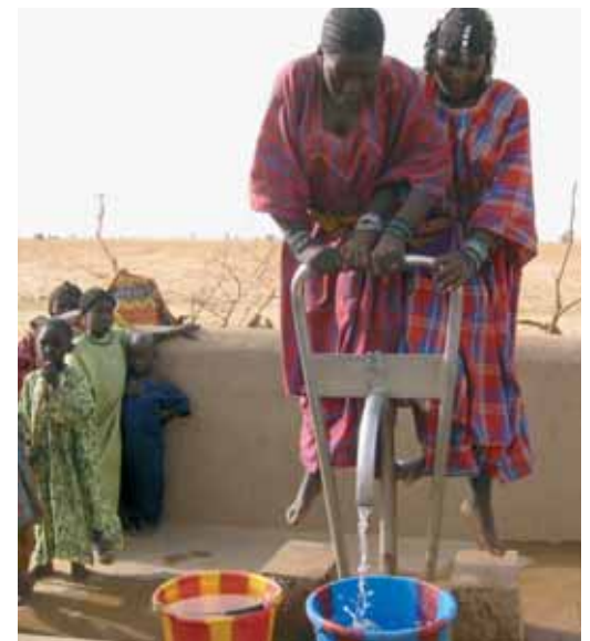
Nutzen entstehen vor allem für Frauen und Kinder

Der Nutzen ist auf dem Gebiet der Produktionssteigerungen relativ einfach zu berechnen. Andere Wirkungen, die darüber hinausgehen (z.B. bessere Konfliktregelung), wurden nicht einbezogen.