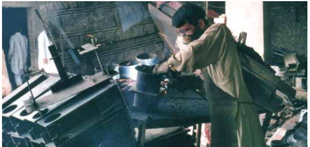
Produktion von Handpumpen durch das örtliche Kleingewerbe, Indien

Ein Grossteil dieser Wirkungen hat einen direkten Bezug zur guten Regierungsführung (Gouvernanz). Sowohl auf lokaler, wie auf